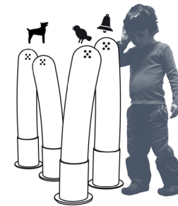
Les tubes à sons