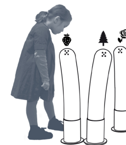
Les tubes   odeurs