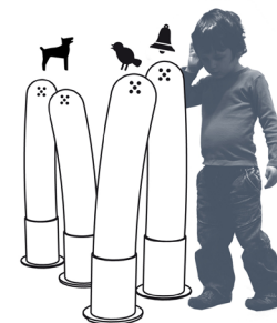
Les tubes   sons